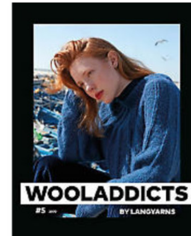
Lang Yarns Heft "WOOLADDICTS #5"