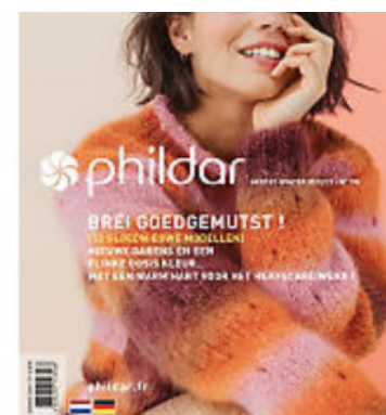
Phildar Heft Damen "Herbst- Winter 2020/21" No. 190