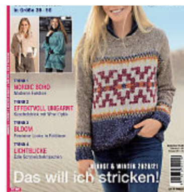
Austermann Heft "Maschen-Style SC 005 Herbst/Winter 2020/2021"