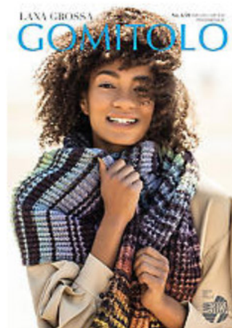
Lana Grossa Heft "Gomitolo No. 6/20"