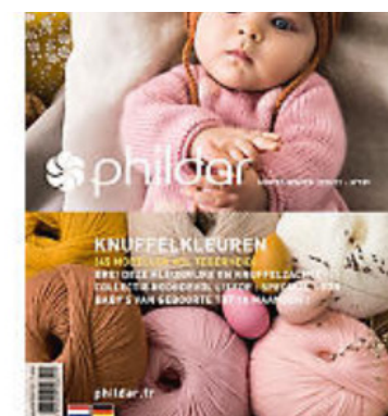
Phildar Heft Babys "Herbst-Winter 2020/21" No. 189