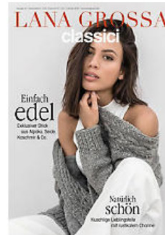
Lana Grossa Heft "Classici No. 19"