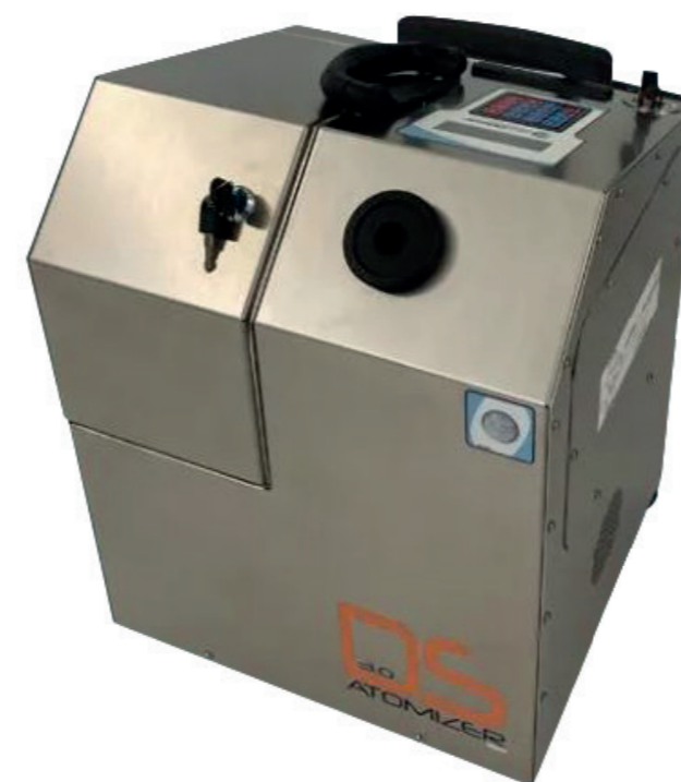
MICRODEFENDER 3.0 - DISINFEZIONE & DISINFESTAZIONE CON NEBULIZZAZIONE SECCA, CUSTODIA IN INOX Art. Nr. 39110560