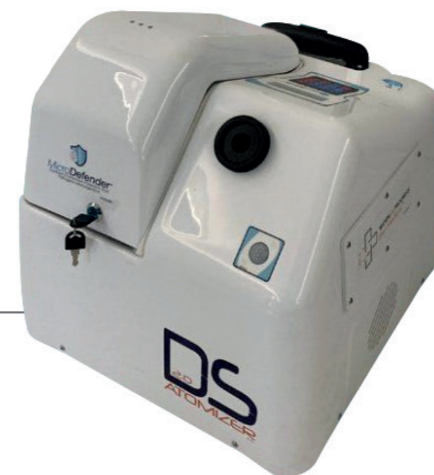
MICRODEFENDER 2.0 - DISINFEZIONE & DISINFESTAZIONE CON NEBULIZZAZIONE SECCA, CUSTODIA IN PLASTICA Art. Nr. 39110563