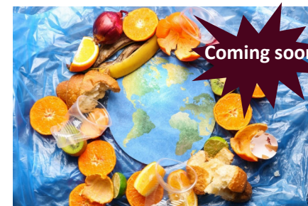
Food Innovation Conference 2. November 2021