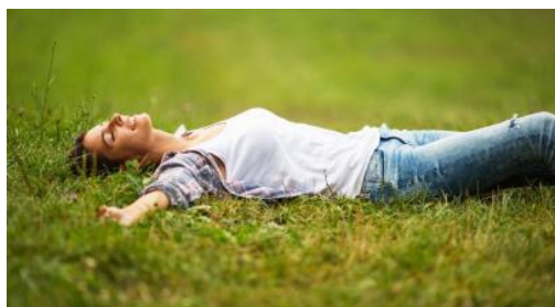
Wellnessconference 6. Oktober 2021

Sensibilisierung Trends und Impulse für Innovation